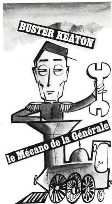
AFFICHETTE 60 x 80