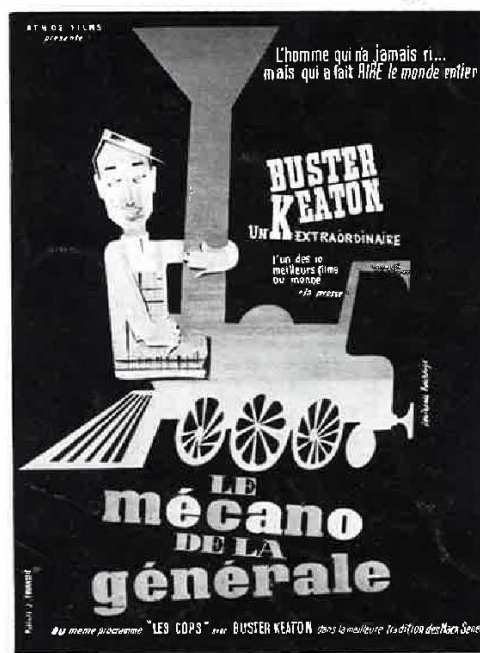
AFFICHE 120 x 160

Vraiment l'un des dix meilleurs films du monde. L'EXPRESS. Le chef-d'œuvre de Buster Keaton... un perpétuel délire de gags. LE FIGARO. Un chef-d'œuvre dans le genre « poursuites ». FRANCE-SOIR. On rit beaucoup, d'un rire franc et sain qui lave le cœur et l'esprit. LE MONDE. Cette œuvre est une des plus subtiles, une des plus intelligentes que le cinéma ait produit. CANDIDE. Ne manquez pas d'aller voir son chef-d'œuvre : LE MECANO DE LA GENERALE. L'HUMANITE. Quel plaisir de revoir Buster Keaton, dans ce grand chef-d'œuvre. ARTS.